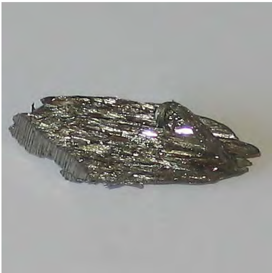
Galet de Thorium purifié

Le thorium, ou thorium 232 [1], est un métal lourd radioactif qui appartient à la même famille chimique (actinides) que l'uranium et le plutonium. Souvent associé aux terres rares , utilisées dans les nouvelles technologies, il est présent en petites quantités dans la plupart des roches. Il est principalement extrait du minerai de monazite. Ses ressources, estimées trois fois plus abondantes que celles de l'uranium , sont assez bien réparties sur la planète, en particulier en Turquie, Inde, Chine, Brésil, États-Unis, Canada, Australie, Afrique du Sud, Norvège. En France, 8500 tonnes de thorium [2] sont stockées, et il y a des gisements en Bretagne.